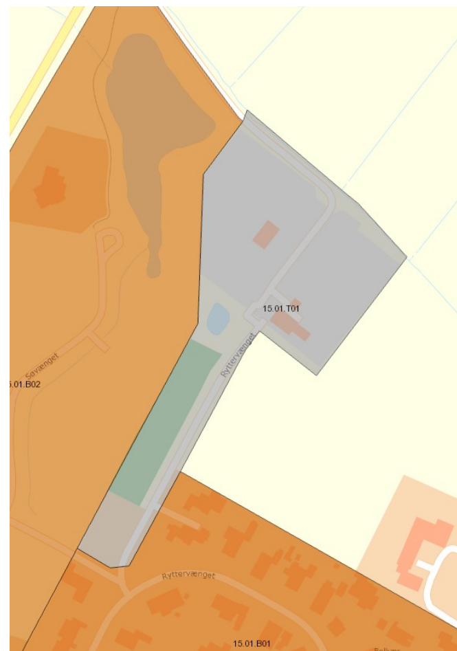
Figur 1: Afgrænsning af rammeområde 15.01.T01 til tekniske anlæg i form af rensningsanlæg.

Nærværende Forslag til Tillæg 13 til Kommuneplan 2017 er ikke omfattet af lokalplan(er).